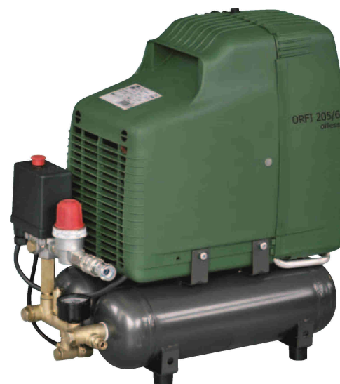
ORFI 205/6 oilless

pozn: oilless = bezmazný Kompresory mohou pracovat při teplotě okolí od +5 °C až do +40 °C. Rozsah automatického cyklu pístových kompresorů řady ORFI je 6–8 bar.